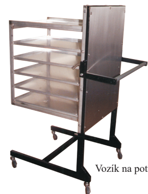
Vozík na potraviny